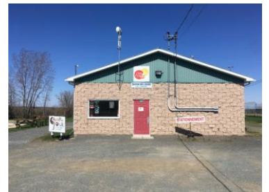
Vue avant du bâtiment

Ces locaux sont débarrés pour l'accès aux toilettes, l'été, et pour enfileur les patins, l'hiver.