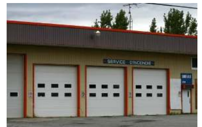
Vue avant de l'édifice

C'est en mai 1976 que Jean-Louis Charpentier, alors maire de la paroisse, demande un permis de construction pour un garage municipal situé sur un terrain appartenant à l'Œuvre des terrains de jeux de L'Avenir. Le coût de construction s'élevait à 62 626 $. Il comprenait sept pièces, soit un bureau, une salle, une cuisine, deux salles de toilettes et deux garages. En 2006, le coût de remplacement s'élevait à près d'un demi-million de dollars. Depuis plus de quarante ans, les travaux publics (la voirie) et le service d'incendie y travaillent côte à côte au bien-être des citoyens de L'Avenir.