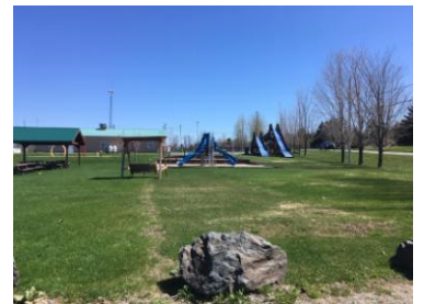
Vue du bas du parc

Ce site comprend un espace ombragé avec plusieurs tables de piquenique et des balançoires de bois pour tous. De quoi occuper les petits comme les grands.