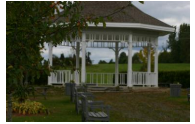
La gloriette a été nommée d'après sa jumelle française

Le parc Jean-Baptiste-Éric-Dorion comprend un espace vert avec plusieurs bancs, ainsi qu'une gloriette hexagonale éclairée de soir. Cette gloriette est maintenant connue sous le nom de Place Saint-Florent-des-Bois en hommage à cette commune française de Vendée. Jumelée à cette commune, L'Avenir entretient des échanges depuis 1988.